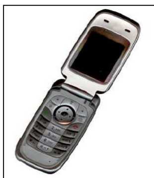
Figura 2 - Ejemplo de una figura con buena resolución.

Análogamente, la Figura 2, nos muestra el ejemplo de una figura con buena resolución.